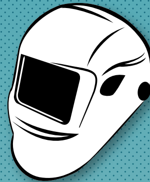
Casco de soldar