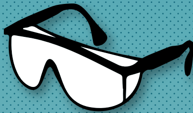
Gafas de seguridad láser